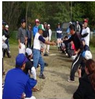
じゃんけんで勝敗を