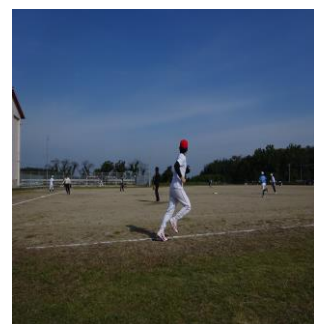
強烈なホームラン