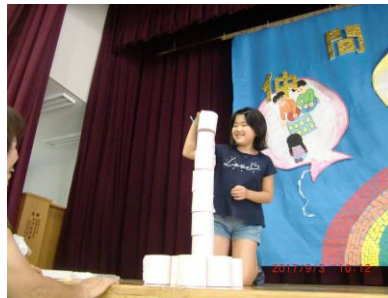
真剣にトイレットペーパーを積み上げる子供たち