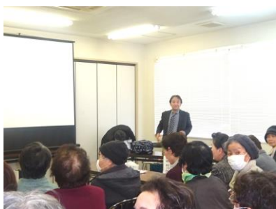
講演する赤池先生