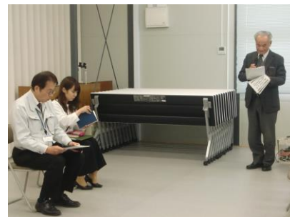
担当課長に謝辞（後藤会長）