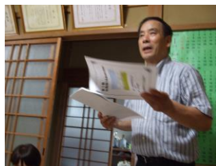
説明する矢口部会長