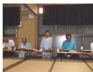
意見を述べる会員