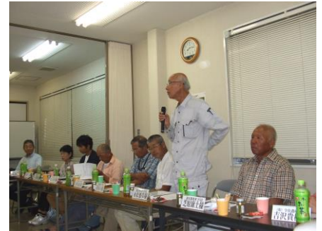
農業体験を発表する会員