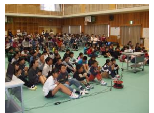
小学生と保護者の皆さん