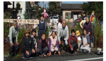
案山子と一体化した関係者