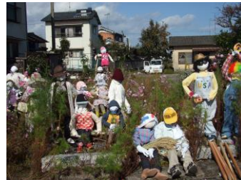
駅前通りのヒーリングスポット