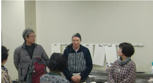
オーストラリア出身の参加者