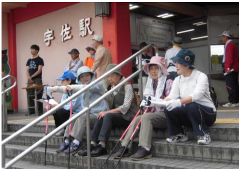
宇佐駅で受付を済ませた参加者

大分県指定文化財である「金丸宝篋印塔」をはじめとした北馬城地区の史跡を前にして「こんなところにこんな史跡があったとは知らなかった」と多くの人が驚いていました。また、居籠88体石仏群では「石仏の謂れ」を聞いて、「朱印」を頂き、「御利益」を頂いて、有難いことばかり？でした。「ご先祖さま!!ありがとうございます。」とつぶやきが聞こえるようでした。