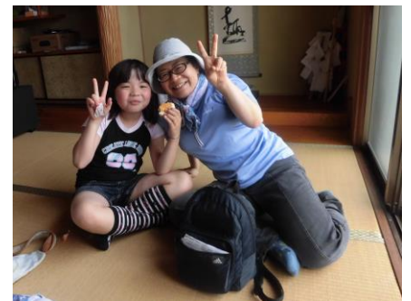
金丸公民館で寛ぐ参加者