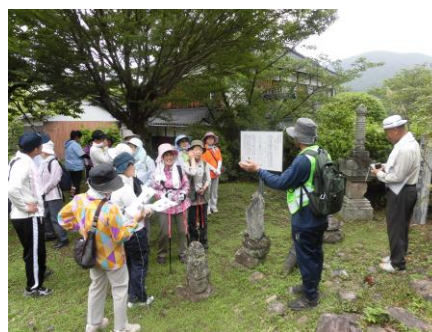
金丸宝篋印塔前で説明を聞く参加者