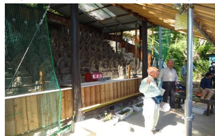
88体石仏について説明