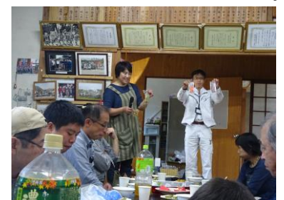
クロダマル製品を紹介