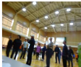
ナベナベソコヌケゲーム