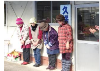
ボランティアの婦人部会