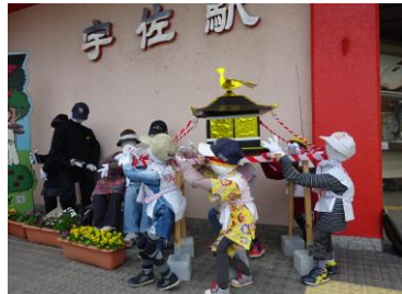
子供神輿を担ぐ案山子