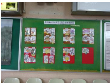
5・6年生による絵手紙

北馬城地区まちづくり協議会は地元住民が時季に応じたイベントを実施し、同駅の乗降客が楽しみ、癒される駅づくりに取り組み、利用者増とイメージアップに努めている。今季イベントは北馬城小学校の協力を得て同校の5、6年生28人が描いた「絵手紙」と北馬城婦人部の有志が作製した子供神輿を担ぐ案山子飾りを宇佐駅に展示しました。是非ご観覧ください。