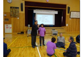
他己紹介する部会長