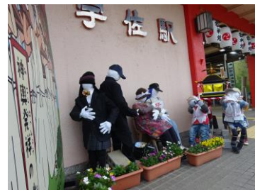
それを見物する高校生と住民