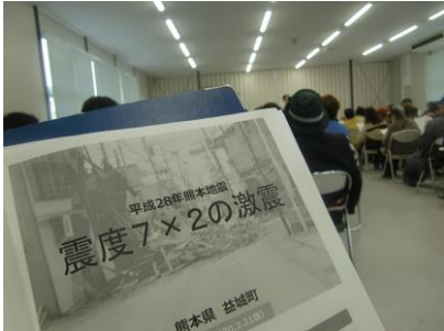
地震被災状況を纏めた資料

平成29年度先進地視察研修を平成30年2月21日（水）に開催しました。益城町は皆さんご存知の通り平成28年4月14日、16日に震度7の地震に見舞われ、大きな被害を受けた街であり、いち早く復興に向けて立ち上がった町あり、現在もその活動を続けている町であります。その役場に行き、もし北馬城地区が災害に遭遇した時の対応について学んできました。益城町での被災現場は見学できませんでしたが熊本城の被災状況を見学し破壊した城郭を目の前にして自然の想像つかない力を思い知らされました。被災した場合の対応にはいくつかの原則があります。家族で話し合っておいてください。備えは早い方がいいですね。