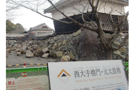
石垣が崩れ傾いた櫓と潰れた櫓