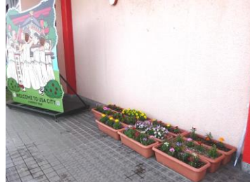
設置されたプランター