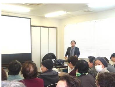
講演する赤池先生