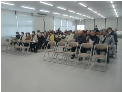
真剣に耳を傾ける参加者